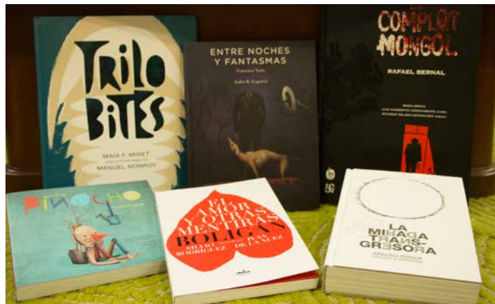
Parte de los ganadores del Premio al Arte Editorial 2017.

El amor y otras mentiras (Almadía Ediciones) de Ángel Boligán. El autor es un artista excepcional que combina la perfección y la audacia del dibujo, el periodismo, el humor inteligente y la crítica. Sus cartones le han valido incontables premios alrededor del mundo, entre los que se cuentan el prestigioso Grand Prix del World Press Cartoon (2006) y el Premio Nacional de Periodismo, el cual ha obtenido dos veces. Una de las características de su trabajo es la atemporalidad. Boligán es un pararrayos que observa las raíces más profundas de la problemática humana actual, para comentarlas y dibujarlas de la forma más seria posible: por medio del humor. En El amor y otras mentiras , Boligán presenta su visión del amor en los escenarios más distintos y en diferentes sabores de la vida amorosa: dulce, amarga, ácida. Retrata la soledad, la complejidad de las parejas, el amor en el mundo contemporáneo. Al pasar las páginas de este libro, el lector descubrirá que no es casualidad que las palabras humor y amor se parezcan tanto.