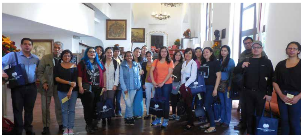
Parte de los participantes de esta edición XXVIII de la Beca Juan Grijalbo.

Se realiza con el apoyo de la Secretaría de Cultura y la Fundación Juan Grijalbo Serres