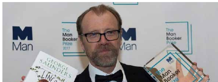
George Saunders con el Man Booker.

Antes que él, fueron reconocidos, entre otros, Hilary Mantel, por Bring Up the Bodies , en 2012; Julian Barnes, por The Sense of an Ending , en 2011; Iwan McEwan, por Amsterdam , en 1998; Kazuo Ishiguro, por The Remains of the Day , en 1989, y J.M. Coetzee, en 1983, por Life and Times of Michael K .