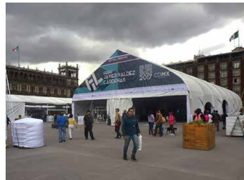
Foro Javier Valdez Cárdenas en la FIL Zócalo 2017.

La xvii Feria Internacional del Libro en el Zócalo de la Ciudad de México (FIL Zócalo) 2017, se desarrolló bajo el lema #CulturaSolidariaCDMX del jueves 12 al domingo 22 de octubre, con alrededor de 1,400 actividades literarias, artísticas y culturales, además de 297 editoriales en exposición y 740 sellos editoriales representados.