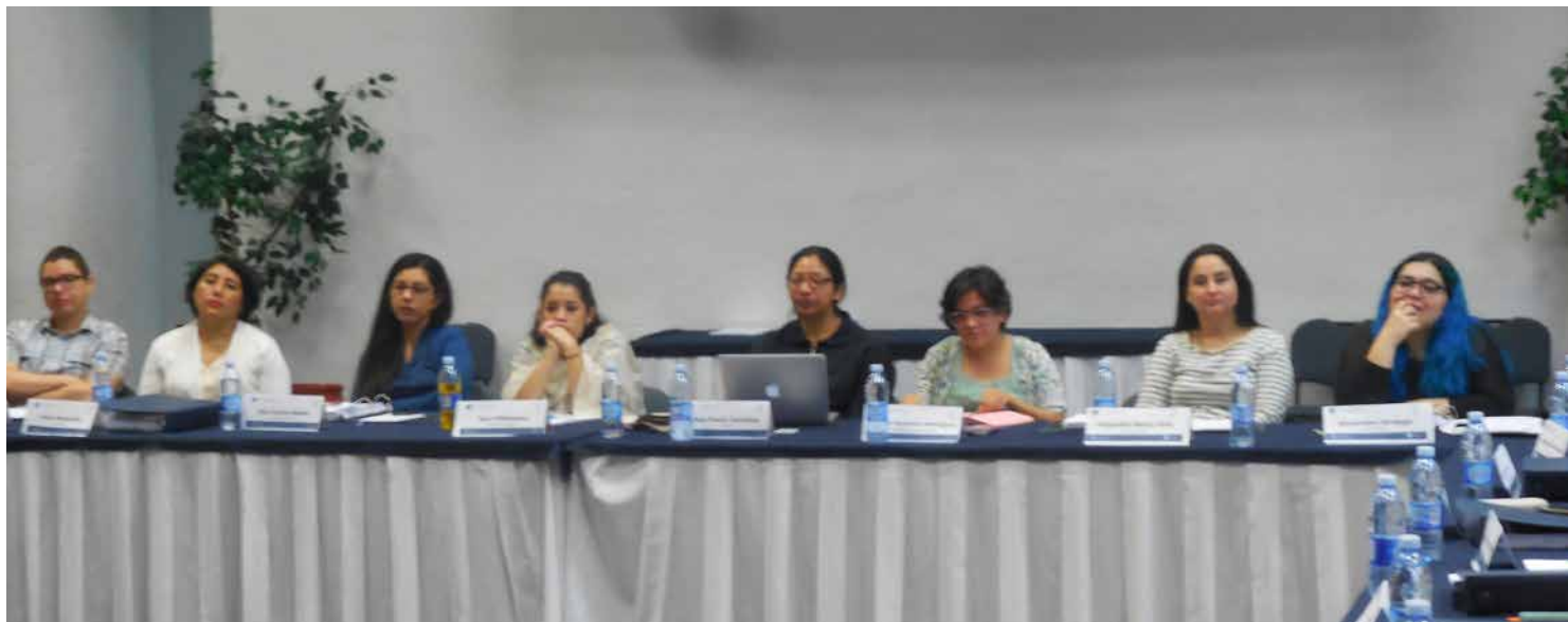
Por una semana los participantes aprenderán de quienes han trabajado por años en la industria editorial.